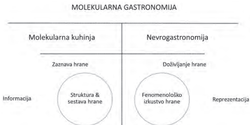
Slika 1: Ključni pojmi in razmerja med njimi

Oglejmo si zdaj nekoliko podrobneje različne faze v procesu doživljanja hrane. Najbrž ni pretiranega dvoma o tem, da svet okrog nas zaznavamo s pomočjo petih čutov (Sternberg, 2011: 88). Čutila opravljajo nekakšno detektivsko vlogo: »Iz množice podatkov objektivne realnosti izberejo le nekatere, ki so dovolj dober približek tistega, kar se v okolju dejansko dogaja. Zaznava ni niti natančen posnetek objektivne realnosti niti poljuben vtis o njej, ampak približek realnosti, ki se je v evoluciji vrste izkazal kot dovolj dober za preživetje.« (Tomc, 2011: 45) Vpogled v notranje procese doživljanja hrane omogočajo predvsem sodobni nevroznanstveni pristopi k raziskovanju nove možganske skorje (metode elektroencefalografa) in limbičnega sistema (metoda funkcionalne magnetne resonance), ki zaznavajo genetske in evolucijsko pogojene odzive na dražljaje iz okolja. V primeru priprave in uživanja hrane sta seveda ključni