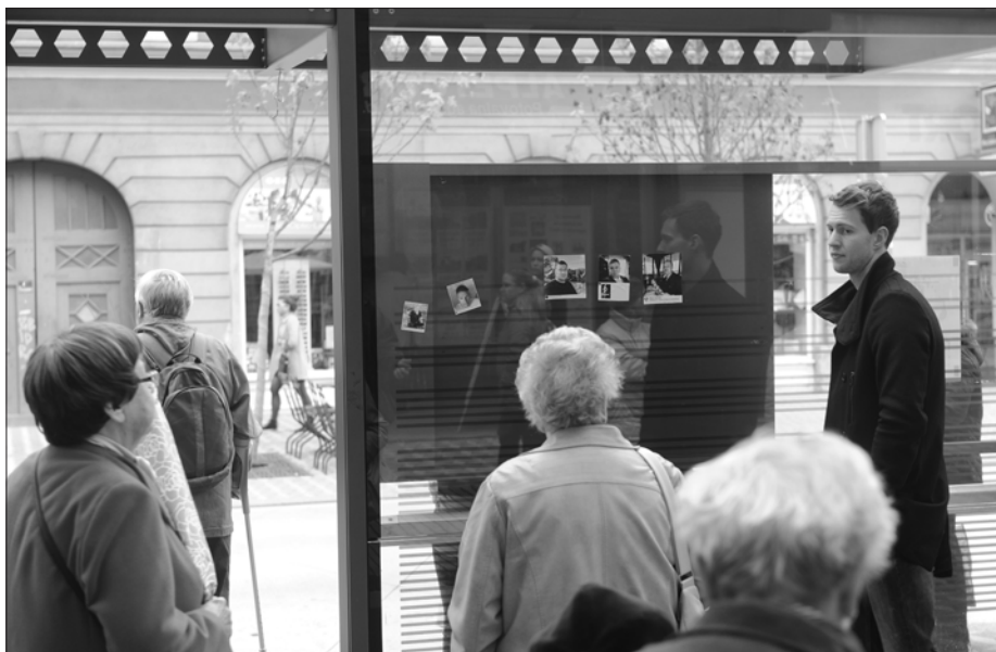
Nalepke portala ZLOvenija v fizičnem prostoru.

Nadaljnja posebnost ZLOvenije je njena prostorska in posledično tudi identitetna fleksibilnost, predvsem potem, ko je projekt izstopil iz digitalne sfere v fizični javni prostor. Ko so namreč posnetki iz digitalnega formata prestopili v fizični svet v obliki nalepk, je ZLOvenija dobila nov pospešek: vdor nestrpnega izrazja iz digitalnega prostora, ki deluje kot fizično zamejena in oddaljena simulacija, je prerastel v realni, nemediatiziran prostor, fizična razgaljenost identitet pa je delovala kot objava tiralic za iskanje oseb, ki so prekršile črko zakona. A kot v intervjuju pojasni avtor portala, je bil tovrstni prehod podob z nasilnimi izjavami v fizični javni prostor povsem nepričakovan, je pa pomenil ključni preobrat, četudi je nastal na podlagi drugih pobud.