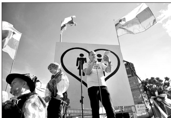
Slika 1: Shod koalicije Za otroke gre! marca 2015.

z »nedolžnostjo otrok«, in z uporabo implicitnega razumevanja, da je homoseksualno razmerje primarno seksualno razmerje. Seksualnost v povezavi z otroki pa je nekaj, kar v populističnem smislu učinkovito vzpostavlja moralno paniko. Robinson (2008) pojasnjuje, da je otroštvo kot družbeni in moralni koncept zasnovan na razliki med odraslo osebo in otrokom, pri čemer je ena ključnih razlik, ki loči odraslega od »nedolžnega« otroka, prav seksualnost. Otrok je namreč razumljen kot nekdo, ki bodisi nima seksualnosti ali ta – v najboljšem primeru – še ni razvita. V besedilih CIDPO je tako mogoče zaznati jasne, čeprav ne nujno (ali praviloma sploh ne) eksplicitno izre-